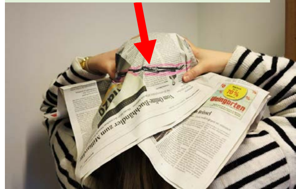
Die Markierung mit dem Filzstift