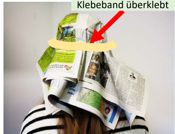
Die Markierung mit Klebeband überklebt