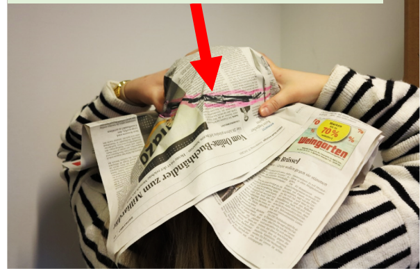
Die Markierung mit dem Filzstift