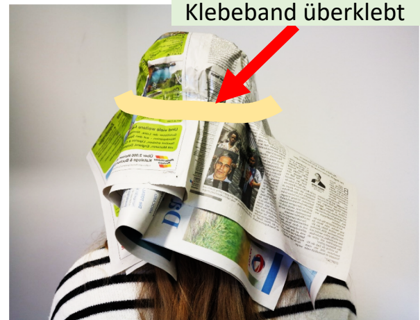
Die Markierung mit Klebeband überklebt